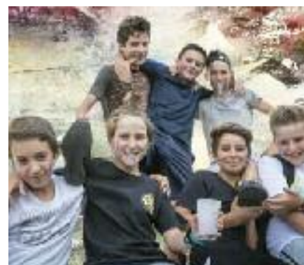
Samedi 16 juin - Jeudi 21 juin - Mardi 26 juin - Championnat du monde de foot à la caserne des pompiers