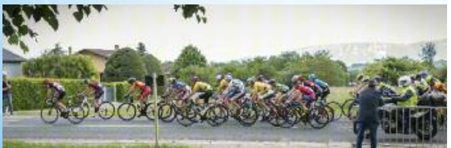
Samedi 20 mai - Passage du Tour de l'Ain