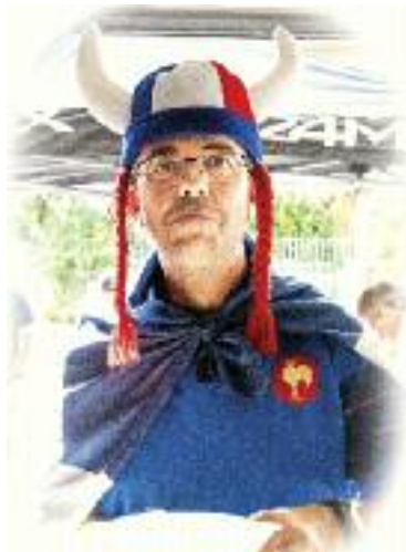
Un supporter sergien.

La première journée s'est d'ailleurs très bien déroulée le samedi 16 juin dernier. Au programme, nous avons proposé une buvette, des planchettes de saucissons