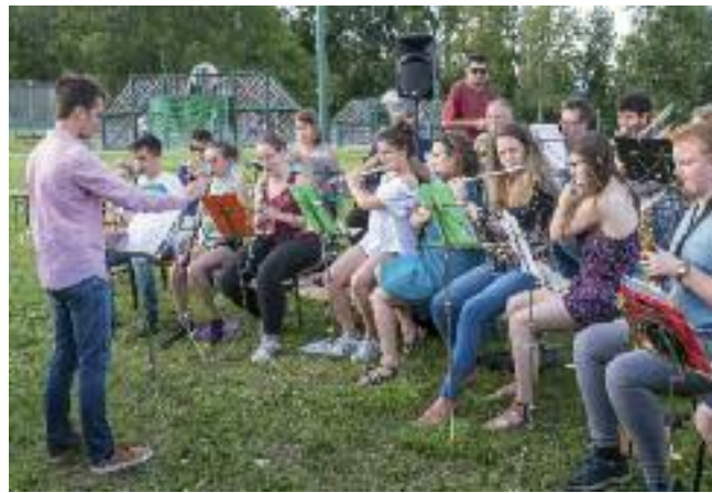
Jeudi 21 juin - Fête de la Musique