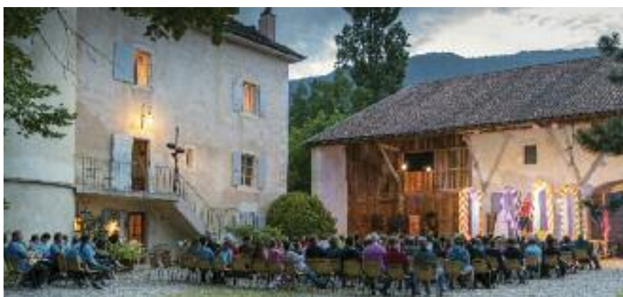
Vendredi 8 juin - Les Mamelles de Tirésias