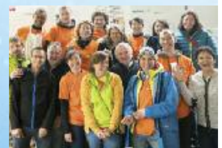
13 mai - Vide-grenier du Sou des écoles