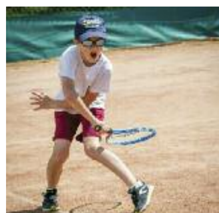
Dimanche 10 juin - Tournoi de tennis Jr