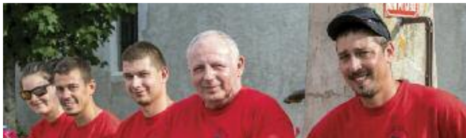
Le bureau de l'Amicale

L'association est composée des sapeurs-pompiers actifs de Sergy ainsi que des retraités et anciens sapeurs-pompiers. Son rôle est primordial puisqu'il permet d'apprendre à connaître ses collègues et aussi travailler en équipe, ce qui amène à un gage d'efficacité lors de nos interventions. Et cela développe également les amitiés inter-générationnelles.