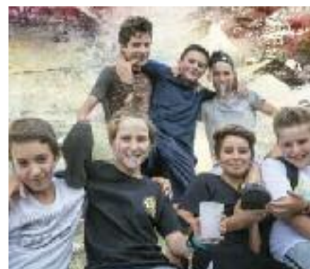
Samedi 16 juin - Jeudi 21 juin - Mardi 26 juin - Championnat du monde de foot à la caserne des pompiers