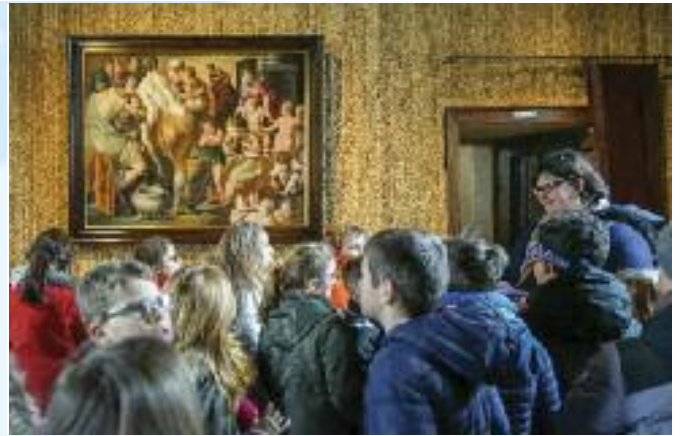
Voyage scolaire de printemps - les châteaux de la Loire