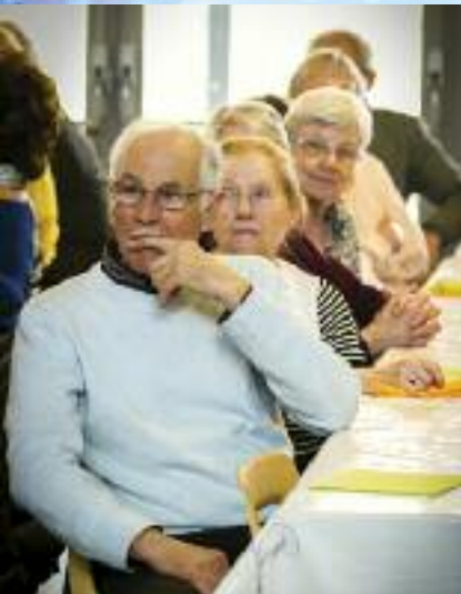
Dimanche 8 avril - Comité de l'Église