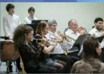
Samedi 12 mai - Concert annuel