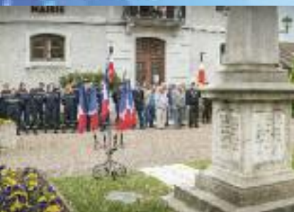
Mardi 8 mai - Cérémonie du 8 mai