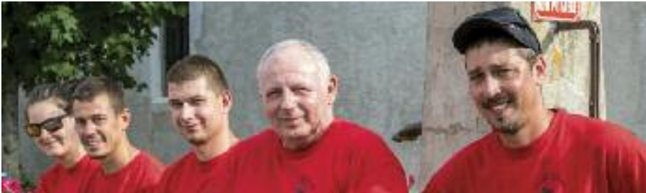
Le bureau de l'Amicale

L'association est composée des sapeurs-pompiers actifs de Sergy ainsi que des retraités et anciens sapeurs-pompiers. Son rôle est primordial puisqu'il permet d'apprendre à connaître ses collègues et aussi travailler en équipe, ce qui amène à un gage d'efficacité lors de nos interventions. Et cela développe également les amitiés inter-générationnelles.