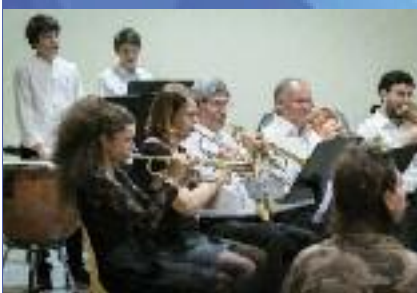
Samedi 12 mai - Concert annuel