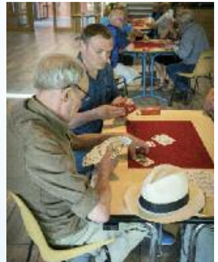
Samedi 12 avril - Tarot de l'Harmonie