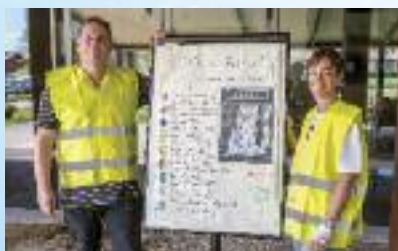
Dimanche 22 avril - Nettoyage printemps