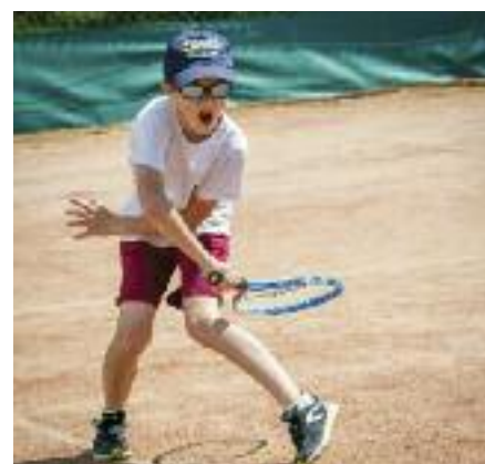
Dimanche 10 juin - Tournoi de tennis Jr