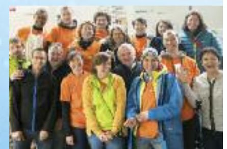
13 mai - Vide-grenier du Sou des écoles