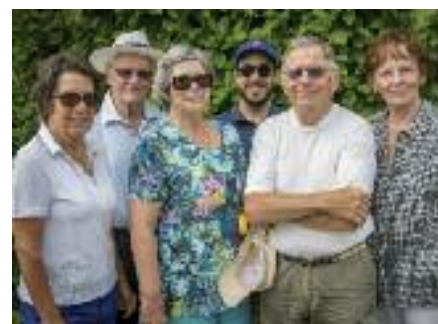
Pétanque - L'équipe du bridge