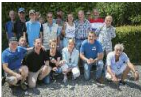
Samedi 26 mai & dimanche 10 juin - Pétanque