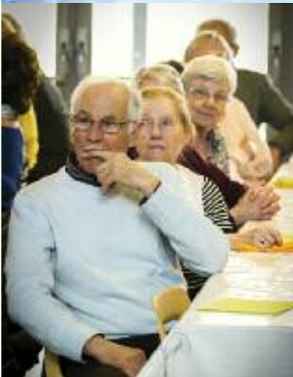
Dimanche 8 avril - Comité de l'Église