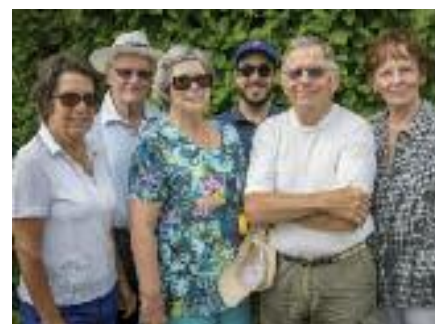
Pétanque - L'équipe du bridge