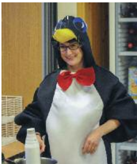
Carnaval du Sou des écoles 2015

L'association est ouverte à tout parent ayant au moins un enfant scolarisé à l'école de Sergy.