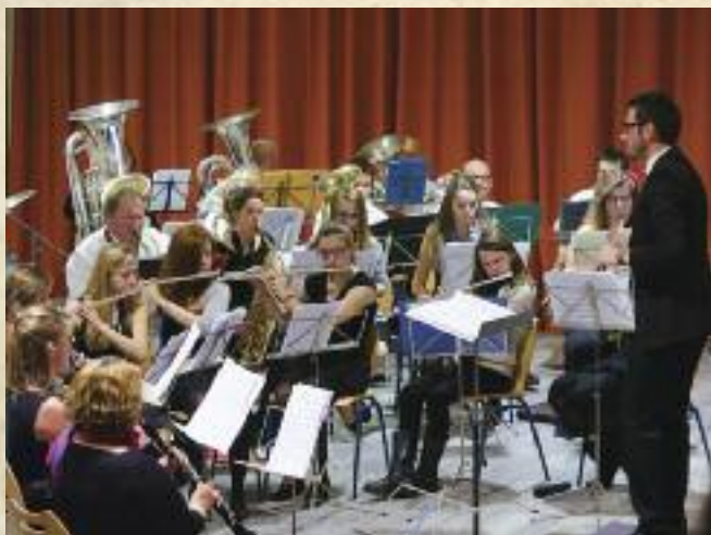
Concert de la Sainte-Cécile