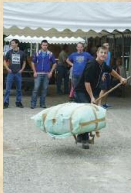
Journée du boudin