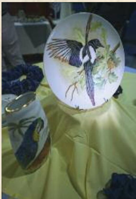
Exposition du Crêt des Arts