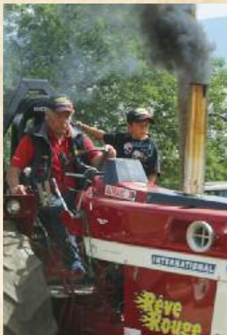
Tire de billons