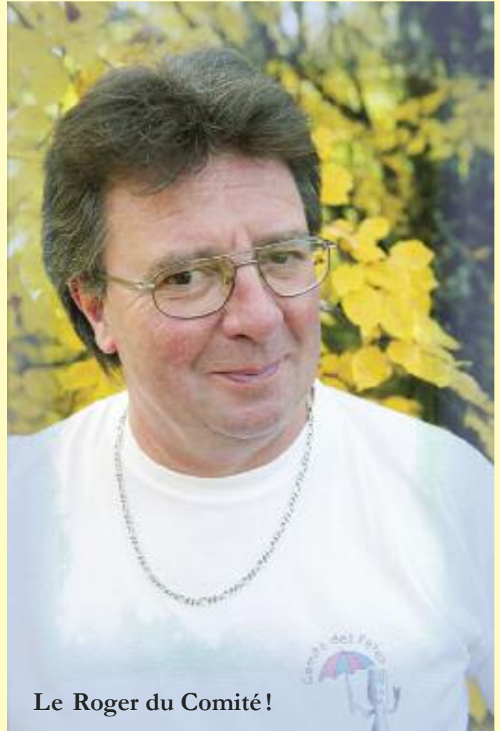
Le Roger du Comité !

Dans le cadre du Sou des écoles auquel je participais en tant que parent d'élève, j'avais contribué à lancer la foire aux plantons. L'année dernière, je m'étais retiré pour des raisons personnelles, cette année le Comité des fêtes a repris exceptionnellement cette manifestation.