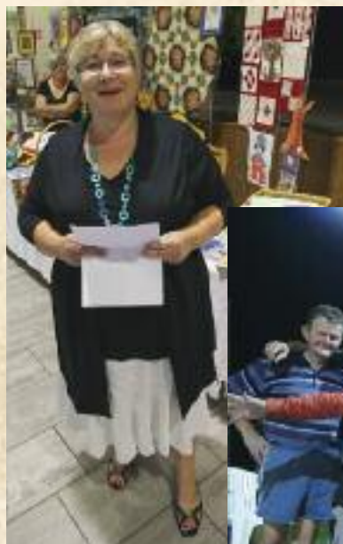
L'édition 2011 du Prix de la Municipalité s'est déroulée sur le terrain de la pétanque. Elle a pu compter sur l'élite de la discipline et le concours s'est naturellement terminé fort tard dans la nuit !