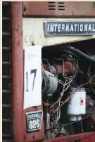
Le tire de billon, toujours plus populaire

L'automne a vu beaucoup de manifestations dont certaines, comme la journée du boudin et le 'tire de billons' qui semblent rencontrer de plus en plus de succès auprès des habitants de Sergy,