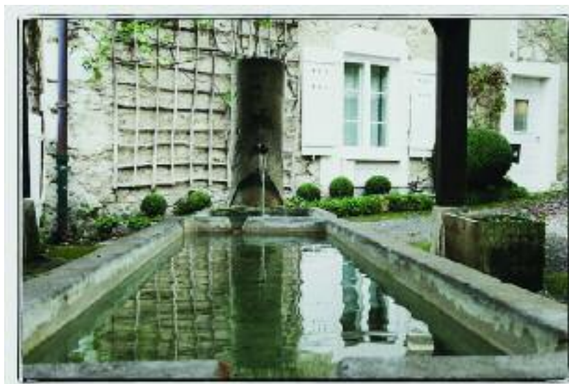
Le lavoir de Sergy

La Tatte : un seul bâtiment à l'époque était également alimenté par un puits et le ruisseau du Marais. Vers les années 1930/35, par convention, la famille Beauvois a fait don à la commune de Sergy du trop-plein de son captage de Fossiaux, ce qui décida la commune à faire un captage sur les terrains 'Laracine' contre un droit d'eau, ceci permettant d'obtenir un débit suffisant pour l'époque et ce sans réservoir de compensation. On obtint ainsi un bouclage sur la colonne d'eau de des-